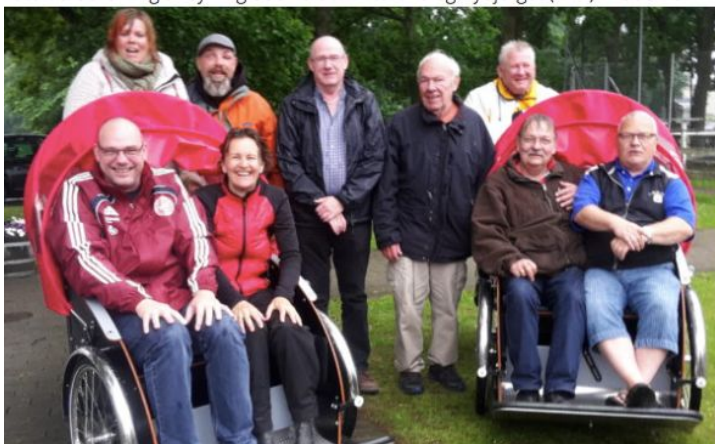
Foto fra udrulning af Cykling uden alder i Kærene og Bybjerget (KAB) i Rødovre

Nabogruppen som fik Cykling uden alder til deres boligområde tilbage i 2016.